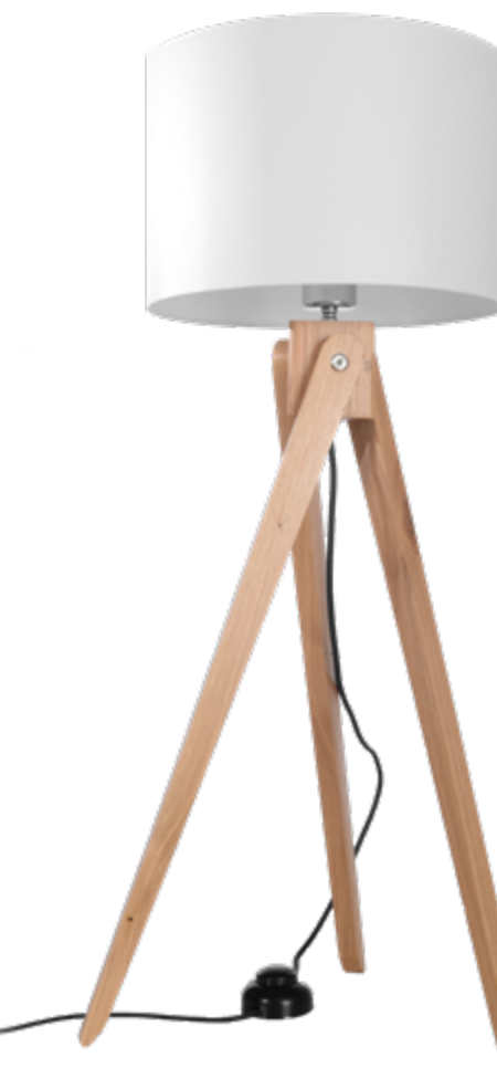
Lampa stojąca | floor lamp Legno 1 SL.0523