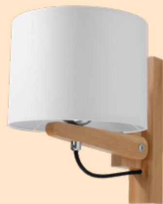
Kinkiet | wall lamp Legno 1 SL.0520

One of the main advantages of the LEGNO series of elegant lamps is the multiplicity of available models. There are wall, plafond and floor lamps. This allows you to illuminate any space while maintaining the complete visual integrity.