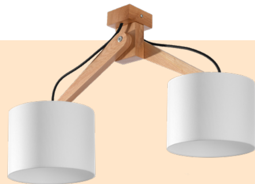
Plafon | ceiling lamp Legno 3 SL.0522