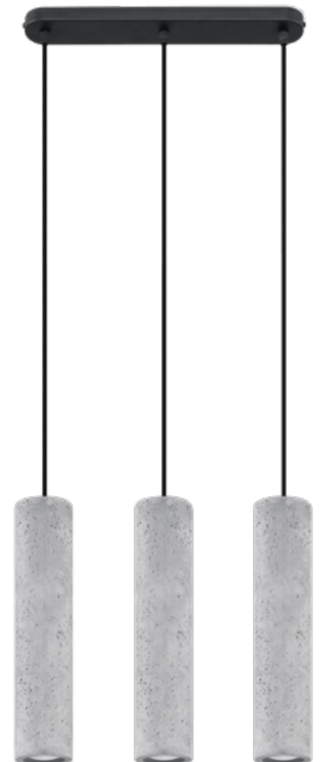
Lampa wisząca | pending lamp