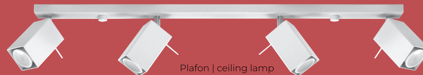
Plafon | ceiling lamp Merida 4L SL.0463

💡 GU10, 2 x 40W, 50Hz, 220V ⊗ biały | white 🏗 stal | steel 📏 8/30/15 cm