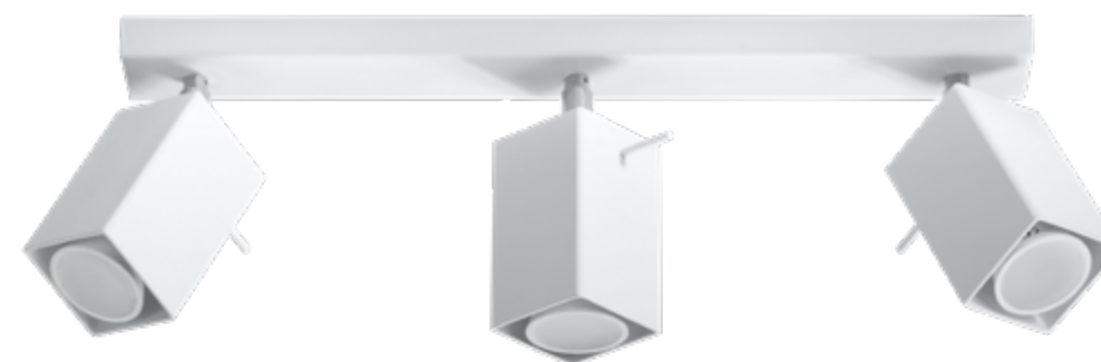
Plafon | ceiling lamp Merida 3 SL.0097

💡 GU10, 1 x 40W, 50Hz, 220V ⊗ biały | white 🏗 stal | steel 📏 10/15/8 cm