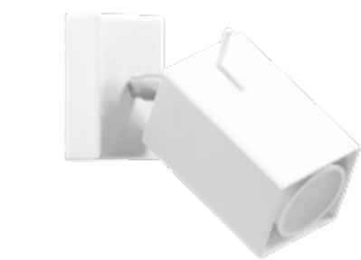
Kinkiet | wall lamp Merida 1 SL.0095

💡 GU10, 1 x 40W, 50Hz, 220V ⊗ biały | white 🏗 stal | steel 📏 10/15/8 cm