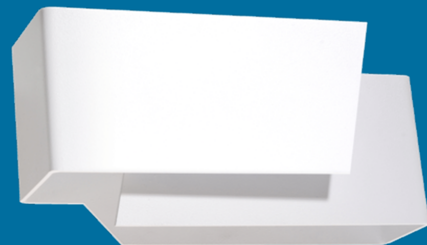
Kinkiet | wall lamp Piegare SL.0394