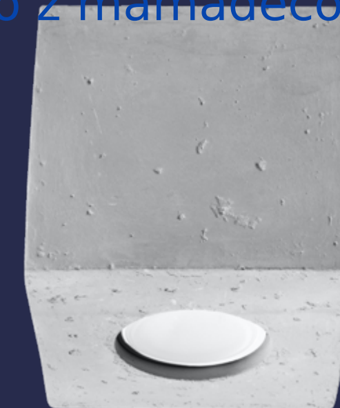
Plafon | ceiling lamp Quad SL.0489