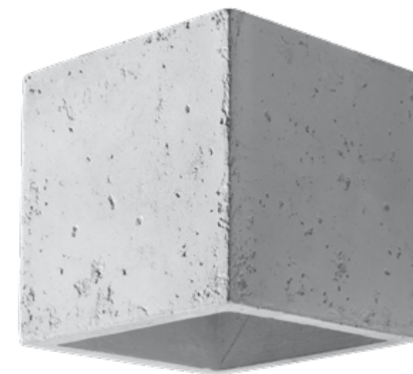
Kinkiet | wall lamp Quad SL.0487

This unusual lamp in the form of a geometric solid will appeal to all lovers of modern design. It can be easily adapted to the most original interior designs in which combinations of different materials dominate. The presented plafond has a concrete frame, giving it a raw character. At the same time, the lamp guarantees efficient lighting of the room and is therefore indispensable when creating a cosy interior inspired by Scandinavian trends or industrial design.