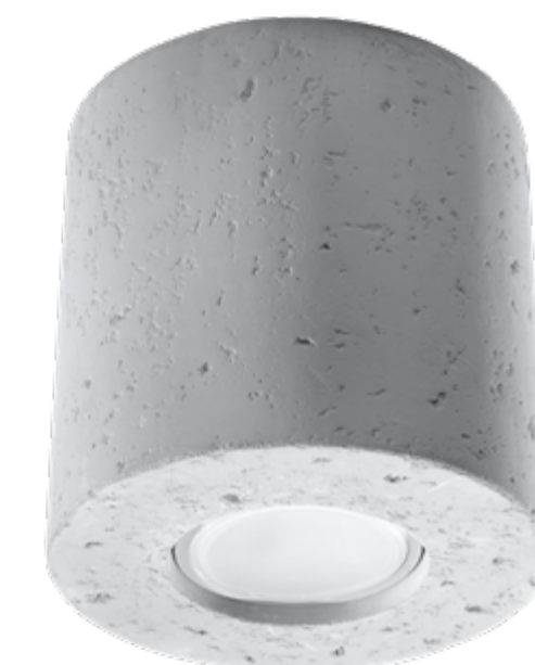
Plafon | ceiling lamp Orbis SL.0488