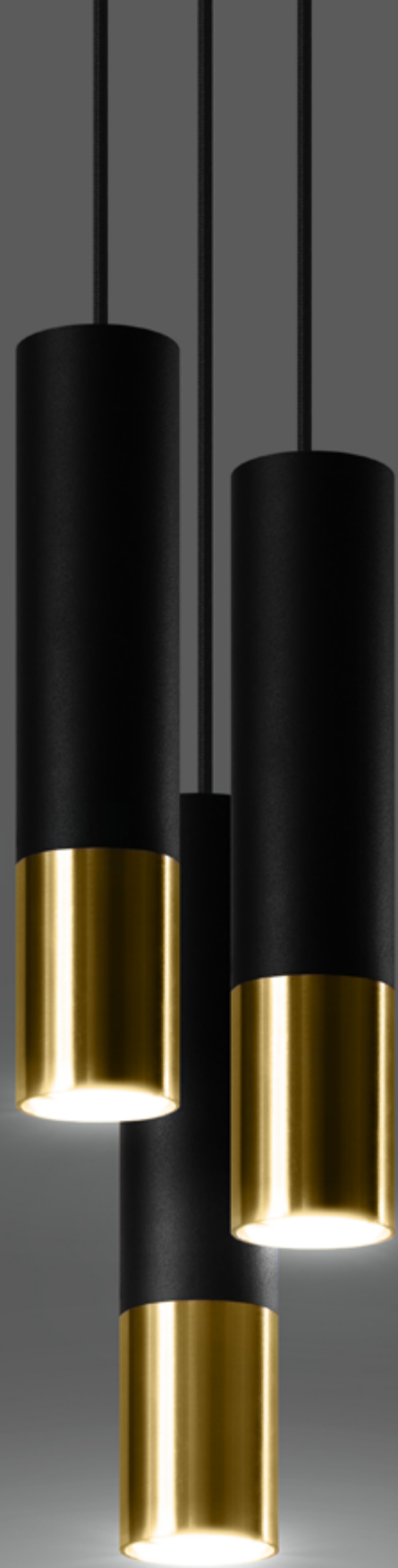
Plafon | Ceiling lamp Loopez SL.0951