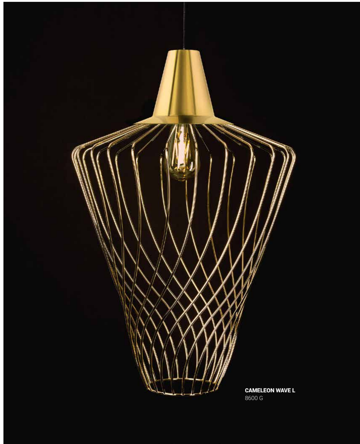
CAMELEON WAVE L 8600 G